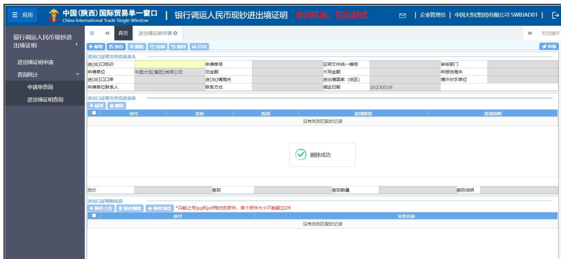
图 进出境证明申请删除