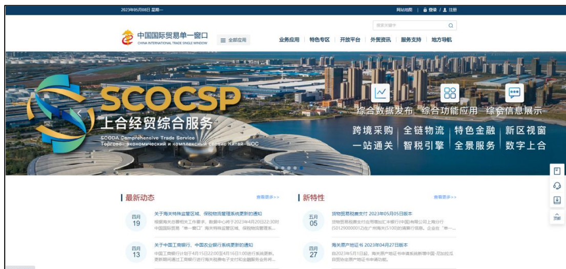
图 “单一窗口”标准版登录

登录网址： https://www.singlewindow.cn ，界面跳转进入“单一窗口”标准版门户网站（如图“单一窗口”标准版登录），在页面右上角点击“登录”字样，进入标准版登录界面。