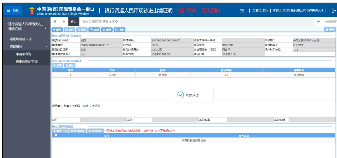
图 进出境证明申请申报

当必填信息全部录入完成后，点击右上角“提交”按钮，系统自动校验录入数据是否符合业务规则，校验通过后系统提示“申报成功”，页面全部置灰，不能继续更改；校验不通过，系统给出相关提示信息，企业按照要求修改数据后，再重新尝试申报操作。如图 进出境证明申请申报。