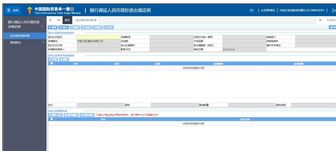
图 进出境证明申请

点击左侧菜单中“进出境证明申请”，右侧区域展示详细信息界面如图 进出境证明申请。根据登录的账号或者卡信息自动返填“申请单位”信息；调用日期由系统自动返填，进（出）口标识选取后，调用日期变为可编辑状态，可根据实际时间进行修改；