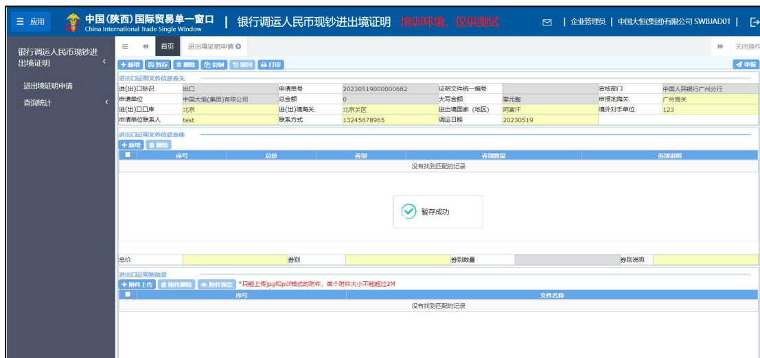
图 进出境证明申请暂存