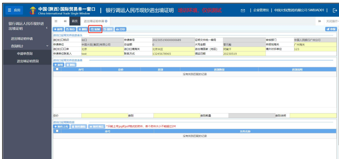
图 进出境证明申请复制

点击界面上方的“复制”按钮，系统自动生成一票新数据，用户暂存成功后可以通过“查询统计-申请单查询”菜单找到新生成的单证数据。